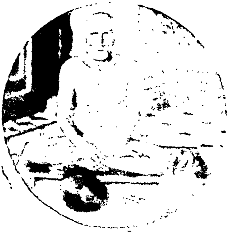
श्रीपरमपूज्य चारित्रचक्रवर्ति आचार्य शांतिसागरजी महाराज.